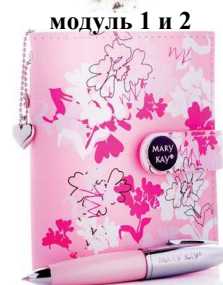
модуль 1 и 2